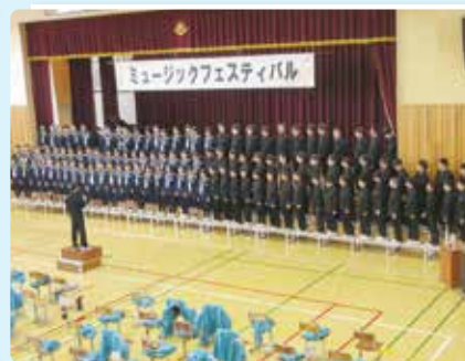
ミュージックフェスティバル