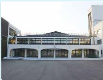
新 中 庭