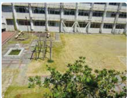
旧 中 庭

そして、「きすみの」と呼ばれる地域で、子どもたちを育て見守る環境も受け継がれています。校舎は改修されても、諸先輩方や地域の皆さんが築き、受け継いでこられた精神や心を微力ながら大切にしていきたいと思います。