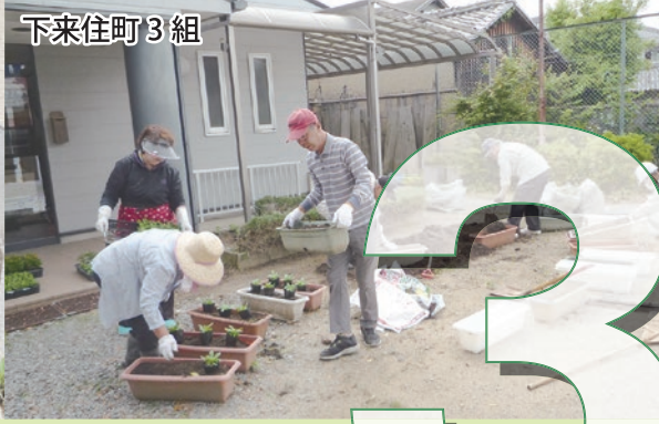
下来住町 3 組