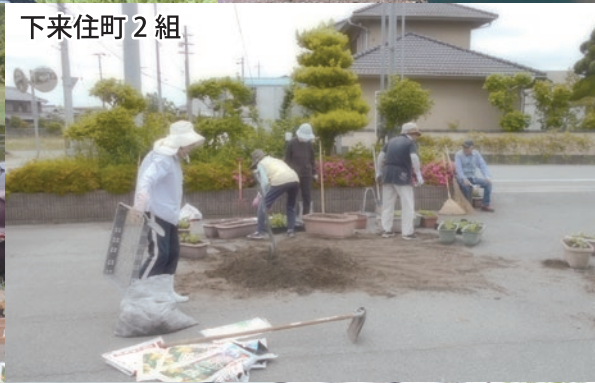
下来住町 2 組