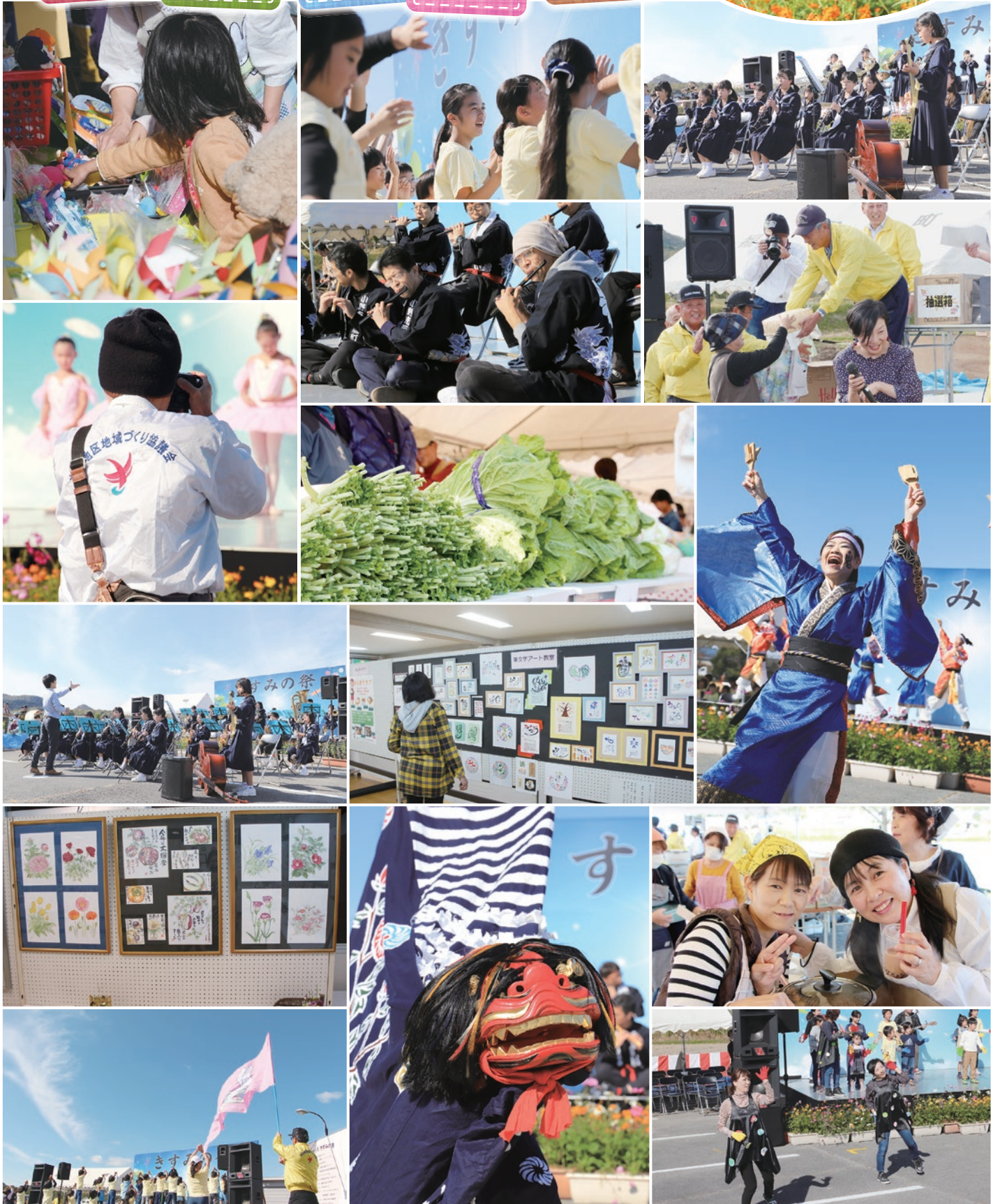
※写真は令和元年「きすみの祭」の様子です。 ※気象に関する警報等が発令された場合、開催内容が変更または中止になる可能性があります。