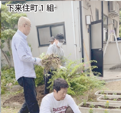
下来住町 1 組