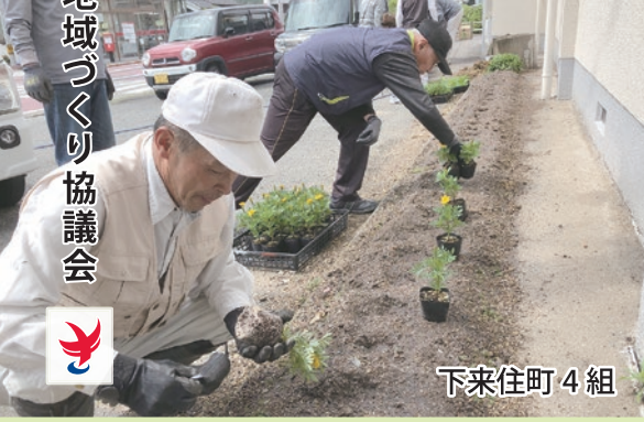
下来住町 4 組